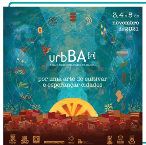
urbBA[21] – Seminário Urbanismo na Bahia