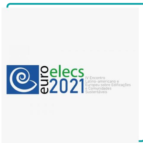
IV Encontro Latino-americano e Europeu sobre Edificações e Comunidades sustentáveis