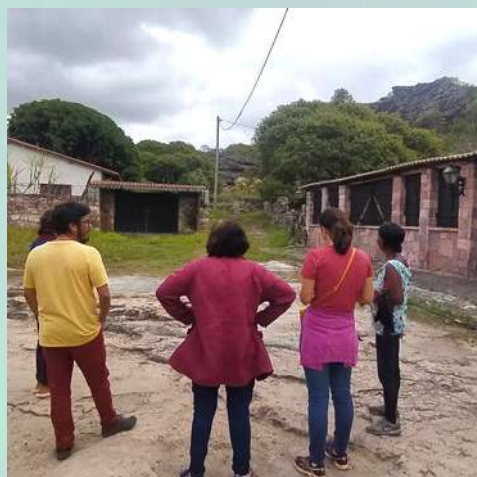
CAMINHADA E ESCUTA DOS MORADORES COM PARTICIPAÇÃO DE TÉCNICOS DO IPHAN